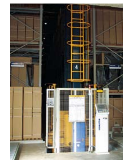
商品出荷倉庫 商品は、簡単な操作で自動的に管理棚に収納されます。コンピューター制御で効率よく管理・出荷されています。