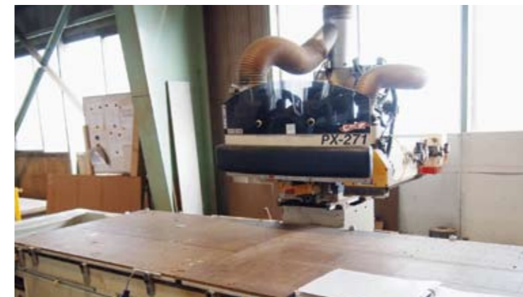
NCルーター 簡単な切削作業から複雑な形状部材の切り出しまでをプログラムに登録し、高精度の切削作業を自動的に行います。