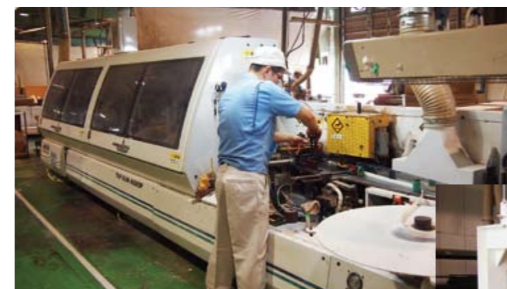
エッジバンダー 部材の木口にテープ等を接着します。